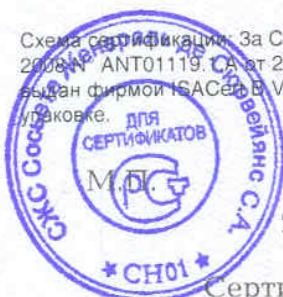
Схема сертификации: За Срок годности и условия хранения указаны на упаковке. Сертификаты системы качества ИСО 9001 : 2008 № ANTO11119. SA от 23/12/2009г, выдан фирмой LRQA + Сертификат системы качества BRC № BRC-IS 63976 от 20/05/2010г, выдан фирмой ISAScert B.V., Ede, The Netherlands. Продукция маркируется знаком соответствия по ГОСТ Р 51074-2003 на упаковке.